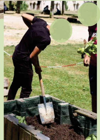
3 - Repiquage