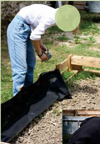
1 - Installation d'un géotextile pour le nouveau bac